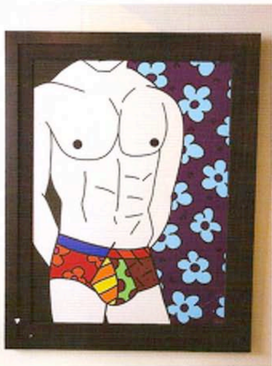
Colorful Underwear, 2008